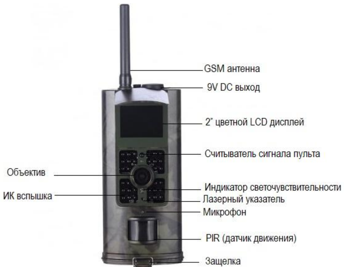
Рис1. Составные части камеры

Камера имеет разъемы: USB порт, слот SD-карты, слот SIM карты, разъем внешнего питания.